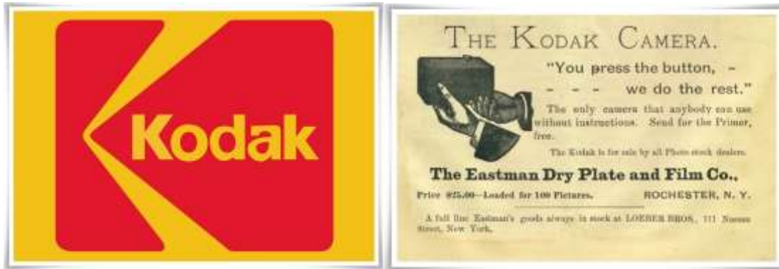
LOGOTIPO DA EMPRESA E UM DOS SEUS PRIMEIROS ANÚNCIOS FEITOS EM JORNAIS DA ÉPOCA.

A FOTOGRAFIA ENTÃO POPULARIZOU-SE COMO PRODUTO DE CONSUMO SÓ A PARTIR DE 1888. A EMPRESA AMERICANA KODAK ABRIU AS PORTAS COM UM DISCURSO DE MARKETING ONDE TODOS PODIAM TIRAR SUAS FOTOS, SEM NECESSITAR DE FOTÓGRAFOS PROFISSIONAIS